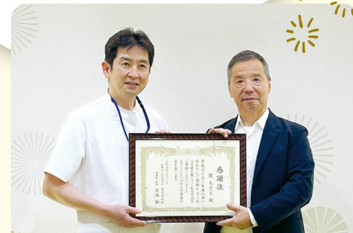
工芸作品をご贈りいただき、2023年6月12日 寄贈式を行いました。