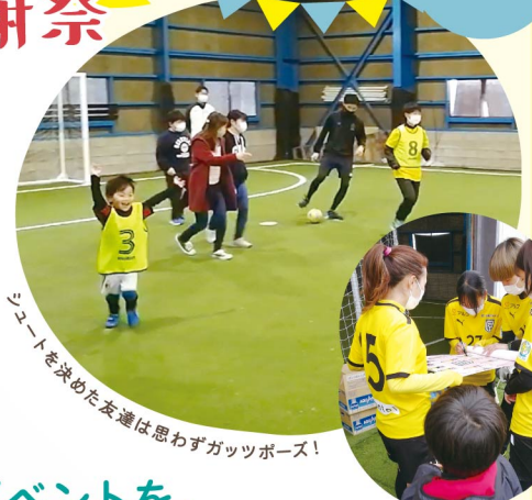
シュートを決めた友達は思わずガッツポーズ!