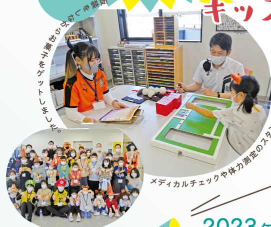
メディカルチェックや体力測定のスキャンラリレー